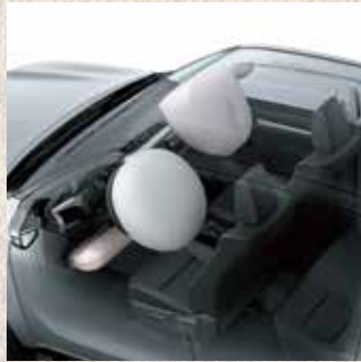
Airbags frontales (conductor y acompañante)*.

*Imagen ilustrativa correspondiente a versión SRV Pack