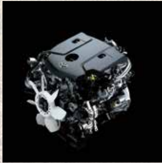
Motor Toyota 2GD.